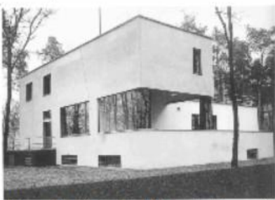
Haus A (Gropius' Haus in Dessau)

Vokabelhilfe : flach : plat / das Dreieck : le triangle / der Stuck : le stuc, moulure / der rechte Winkel : l'angle droit