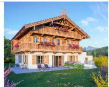
Haus C (Bauernhaus in Tirol)