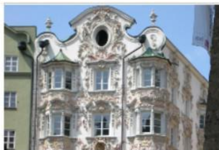
Haus B (Hellblinghaus in Innsbruck)