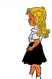
die neue Luise

Aktivität: Welche Unterschiede merkt man bei der neuen Luise und der neuen Lotte?