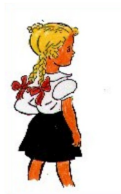
die neue Lotte