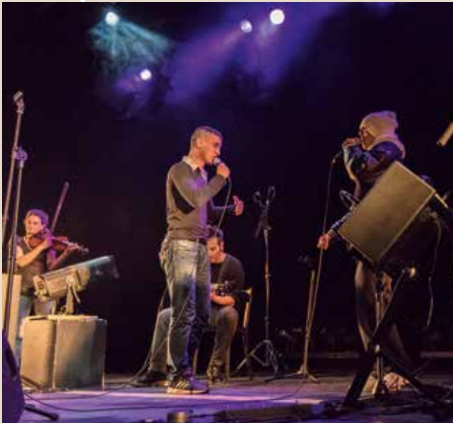
► Mardi 19 mai Concert de Daguerre & Bertille