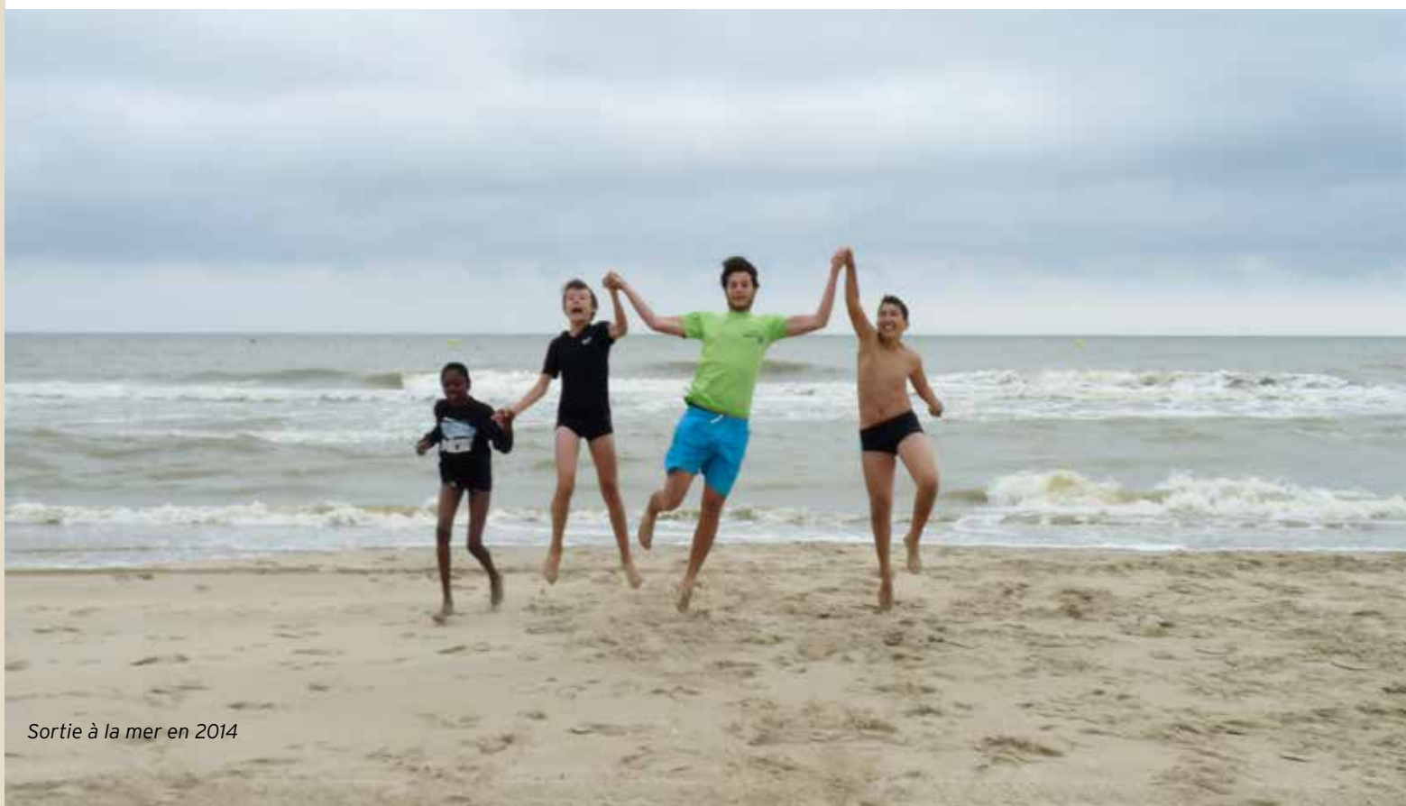
Sortie à la mer en 2014