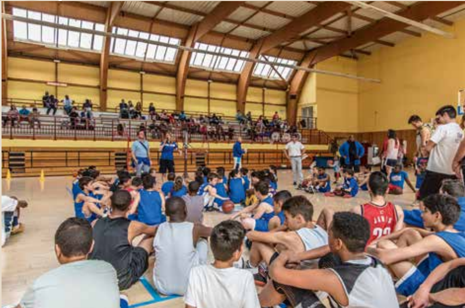
► Dimanche 17 mai Fête du club de basket