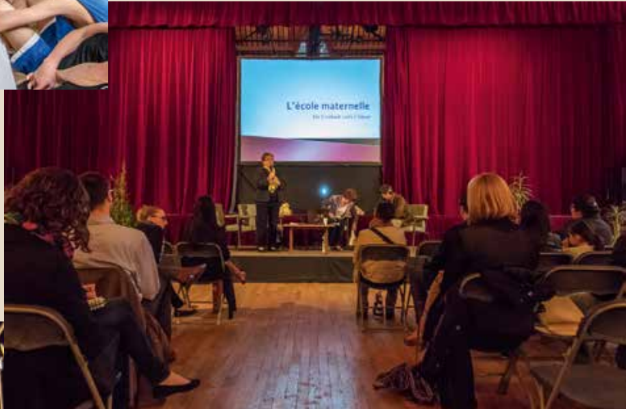
► Mardi 19 mai L'entrée à l'école maternelle dans le cadre du RÉAAP