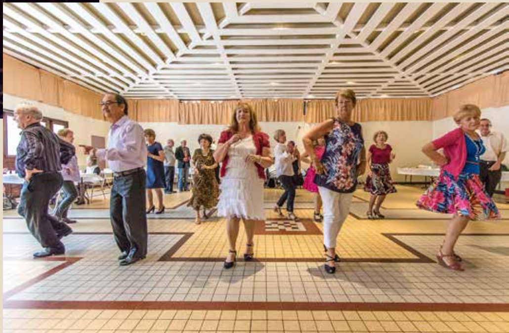
► Vendredi 22 mai Thé dansant au centre socioculturel de l'Épine-Guyon