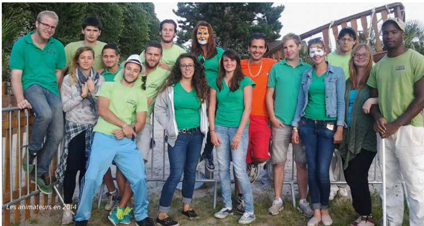
Les animateurs en 2014