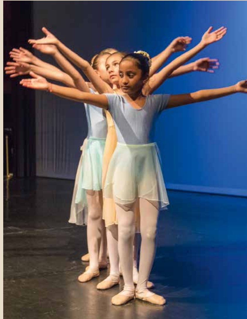
► Samedi 16 mai Danses en scène