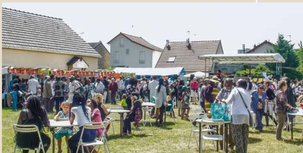
► Dimanche 7 juin Kermesse paroissiale