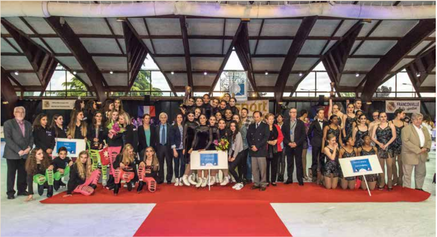
► Samedi 9 mai Championnat de France de ballet sur glace en présence du Président de la Fédération et de celui de la Ligue Ile-de-France