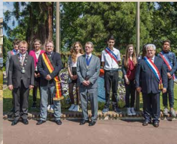
► Dimanche 24 mai Fêtes du Jumelage avec les maires de Viernheim et de Potters Bar