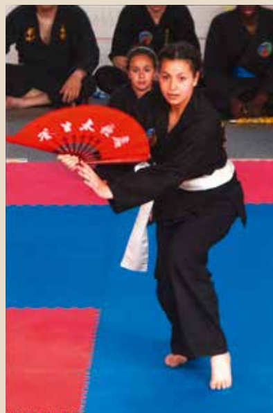
► Samedi 6 juin Gala de fin d'année du club de Viet-Vo-Dao