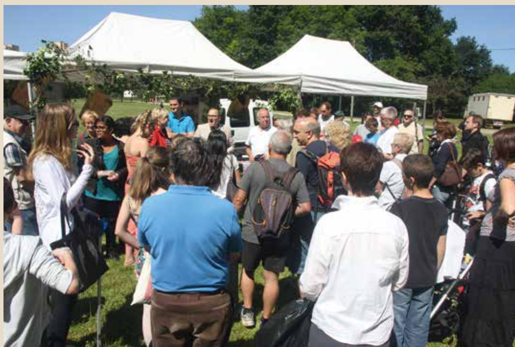
► Samedi 6 juin Journée au Bois « Franconville aime sa nature »