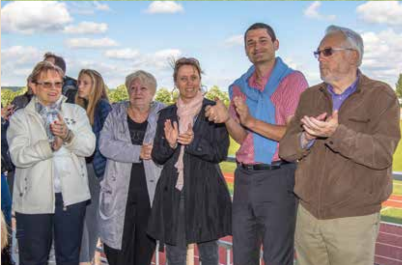
► Samedi 16 mai Challenge Estrebou, Levigne et Schlemmer