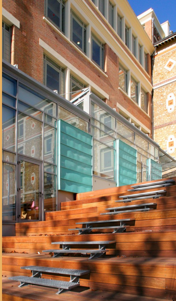
LYCÉE LA BRUYÈRE 31, Avenue de Paris, 78000 Versailles