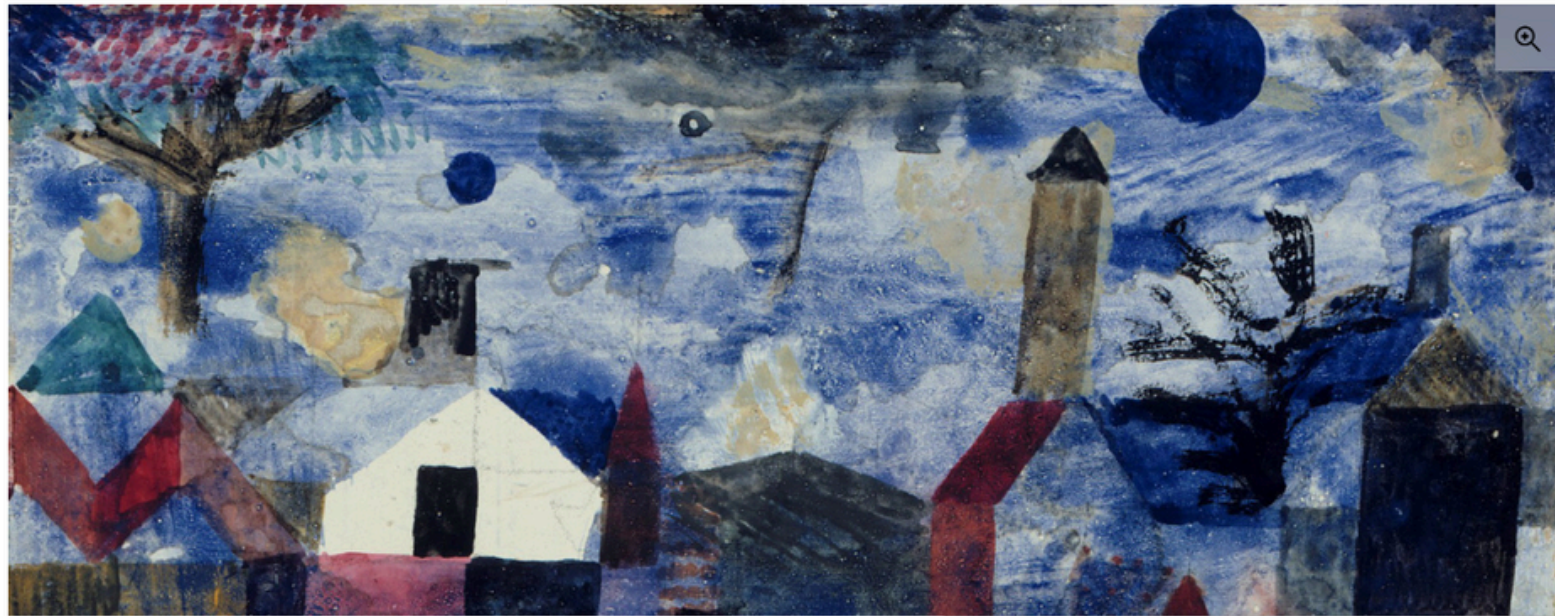
Paul Klee (1879-1940)