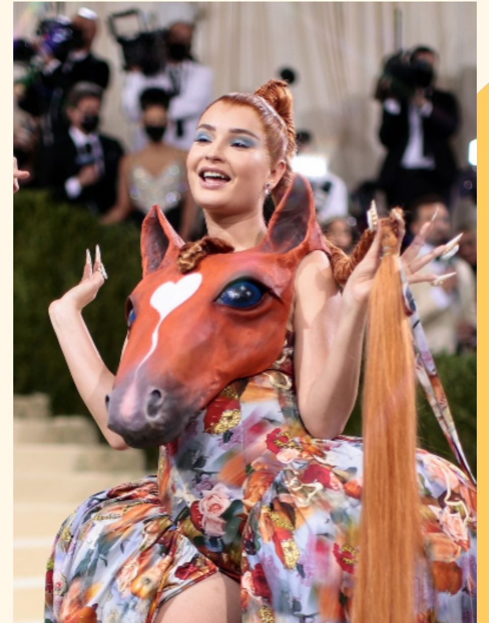
KIM PETRAS, MET GALA 2022