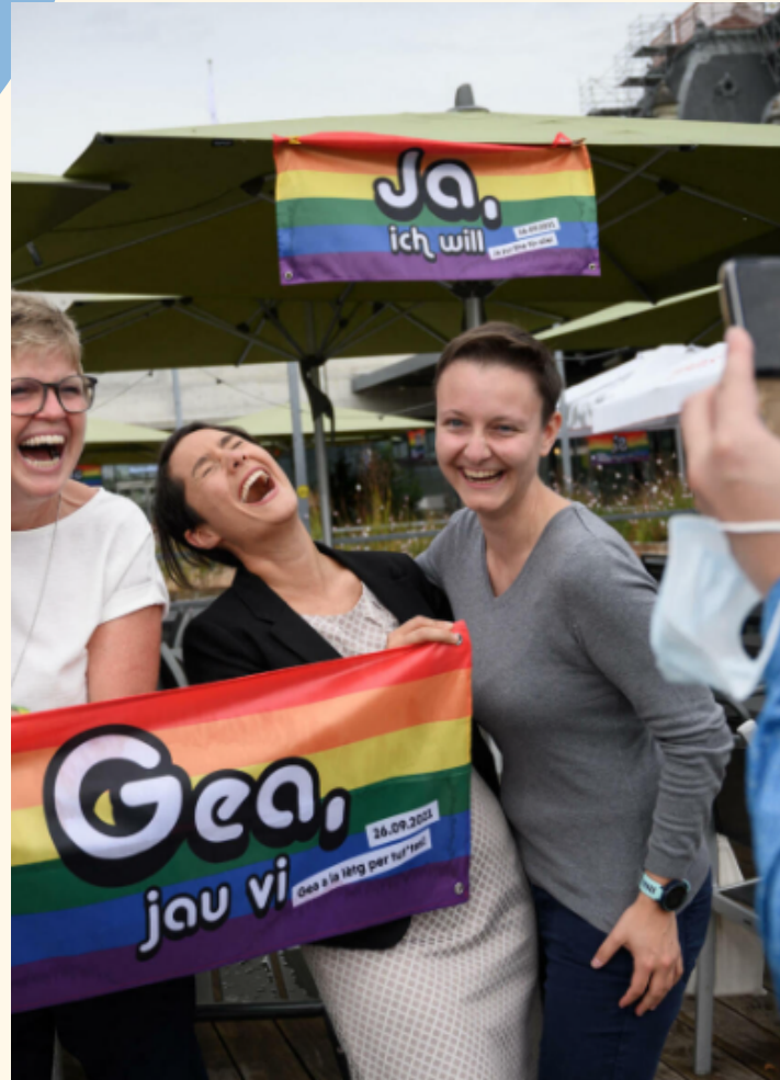
LE 26 SEPTEMBRE 2021, 64% DES SUFFRAGES EN FAVEUR DU MARIAGE POUR TOUS EN SUISSE