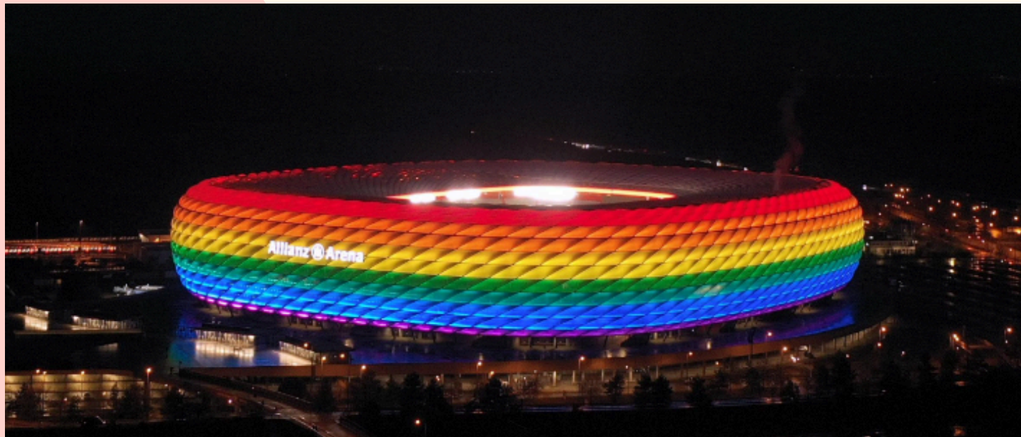
2021, L'ALLIANZ ARENA DE MUNICH ÉCLAIRÉE AUX COULEURS LGBT